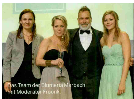
Das Team der Blumeria Marbach mit Moderator Froonk.