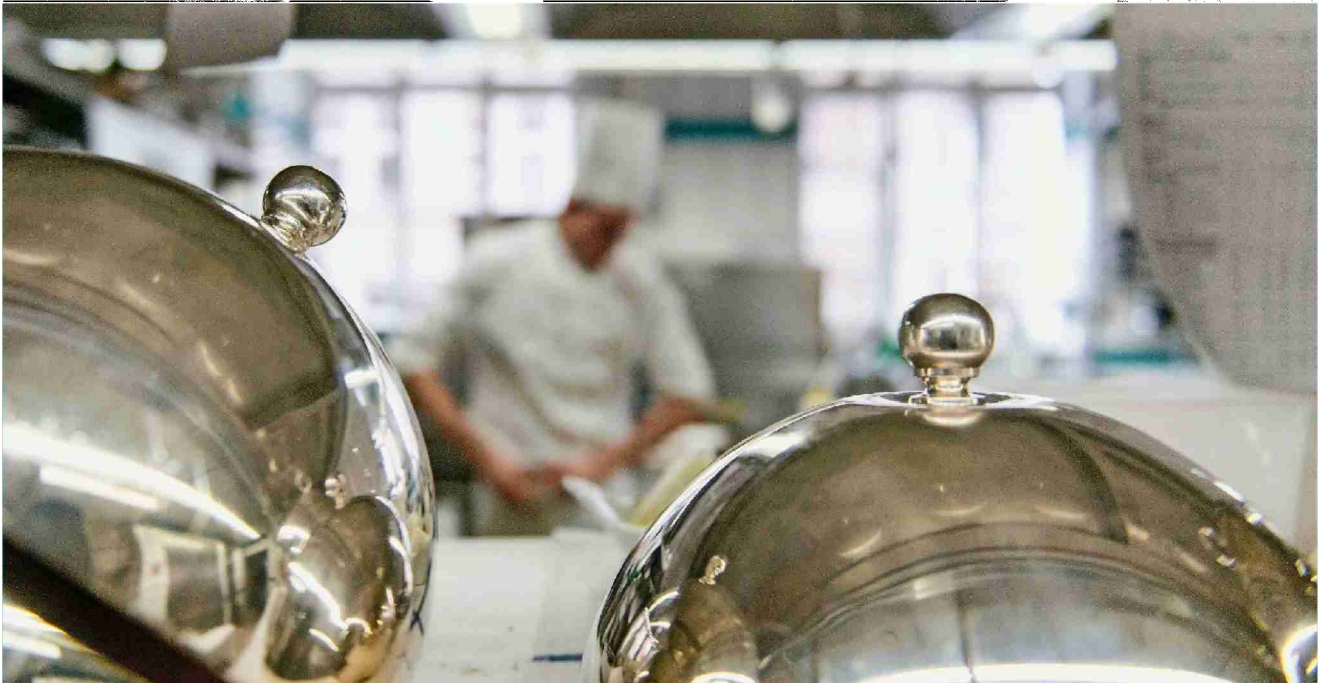
Neue Perspektiven für Hotelleriebeschäftigte: Jobsharing zwischen Sommer- und Winterdestinationen erlaubt ganzjährige Anstellungen.

Themen-Nr.: 571.264 Abo-Nr.: 1092015 Seite: 11 Fläche: 78'821 mm 2