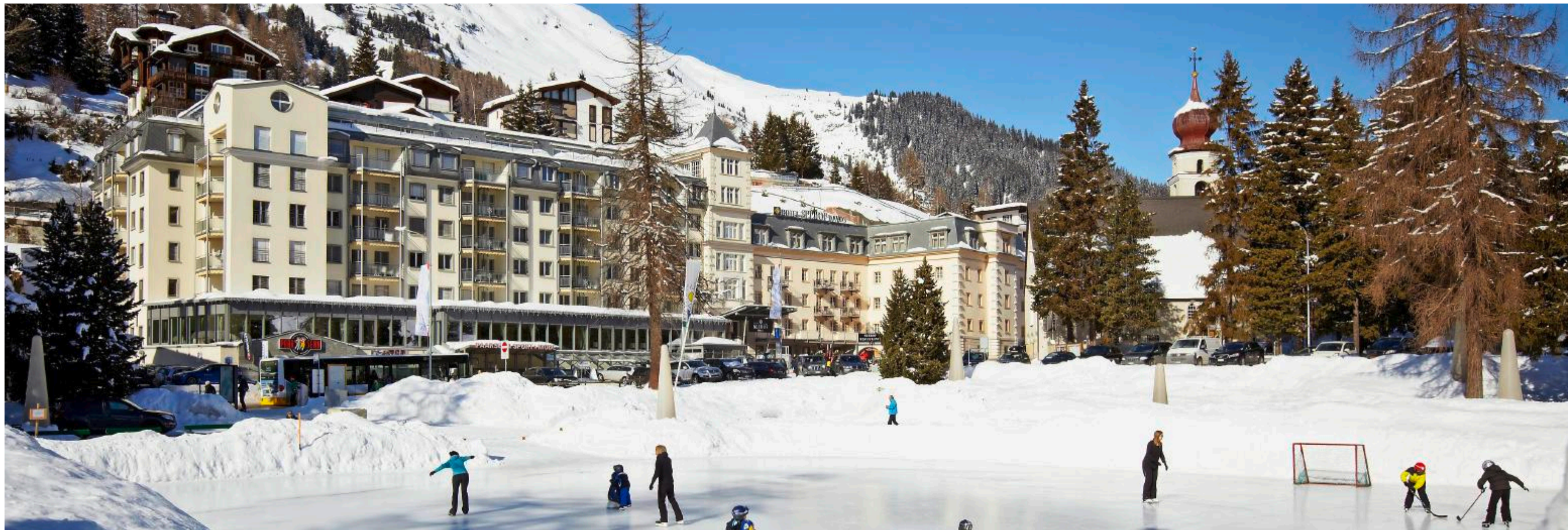
Hotel Seehof: Die Besitzer investierten bis zur Wiedereröffnung in 15 Etappen gesamthaft 3 Millionen Franken in den Wellnessbereich