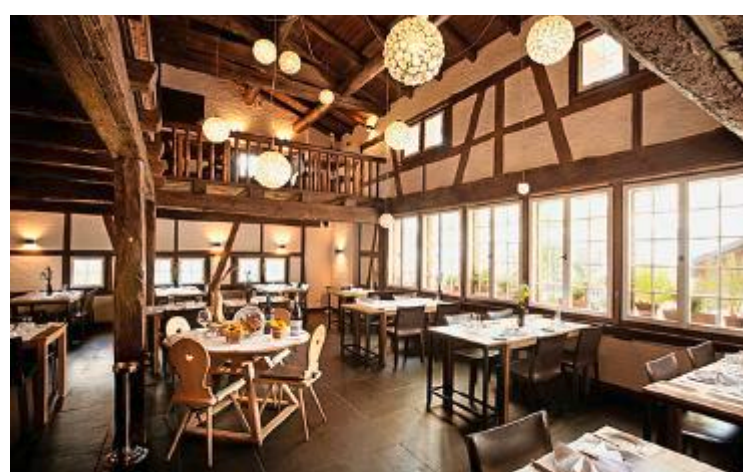
Maiensässhotel Guarda Val, Lenzerheide-Sporz (l.), Wellnesshotel Pirmin Zurbriggen in Saas-Almagell

5. [6] Waldhotel National, Arosa GR Tel 081 378 55 55, waldhotel.ch ► DZ ab 520 Fr. Ständiger Ausbau und Investitionen lohnen sich: Im Waldhotel gab es nie eine Krise.